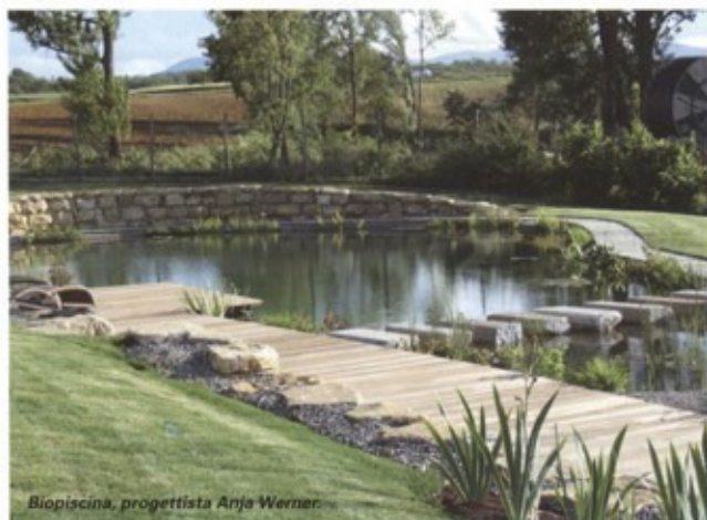
Biopiscina, progettista Anja Werner.