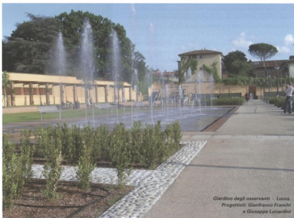
Giardino degli osservanti - Lucca. Progettisti: Gianfranco Franchi e Giuseppe Lunardini

Dal 29 Settembre al 1 Ottobre si è tenuto a Merano il 5° Congresso dell'Associazione Internazionale Biopiscine sul tema "Biopiscine e Wellness". Un incontro che ha avuto un grande successo, tenuto per la prima volta in Italia per la determinata volontà della collega Anja Werner, che in questo campo è fra le più accreditate professioniste. Più di 200 partecipanti provenienti da ben 13 nazioni affollavano la grande sala "Kursaal" del Kurhaus, segno che l'interesse attorno a questo nuovo modo di realizzare le piscine provoca un crescente interesse tra i profes-