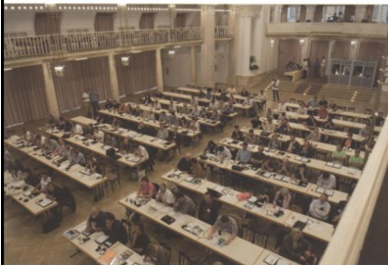
Merano, 5° congresso internazionale delle biopiscine sala "Kursaal", Kurhaus.

Da queste citazioni è possibile percepire come anche nel nostro paese un ricco nucleo di progettisti della nuova generazione riesce a mettere la cultura paesaggistica italiana al passo con i tempi e a dare il suo contributo innovativo anche in un segmento molto specialistico come quello della presenza dell'acqua nel giardino. ■