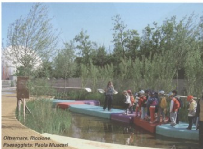
Oltremare, Riccione. Paesaggista: Paola Muscari

Vorrei concludere questa carrellata con un intervento atipico rispetto ai discorsi fatti sino ad ora che hanno posta la centralità dell'acqua nel giardino, nel paesaggio, nella struttura urbana mostrando una realizzazione curata da Franco Zagari, uno dei più brillanti maestri nella progettazione paesaggistica. Non si tratta né di una piscina, né di un laghetto ar-