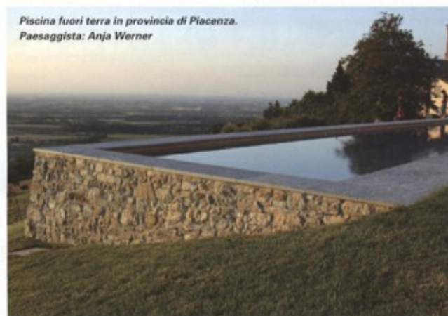
Piscina fuori terra in provincia di Piacenza. Paesaggista: Anja Werner